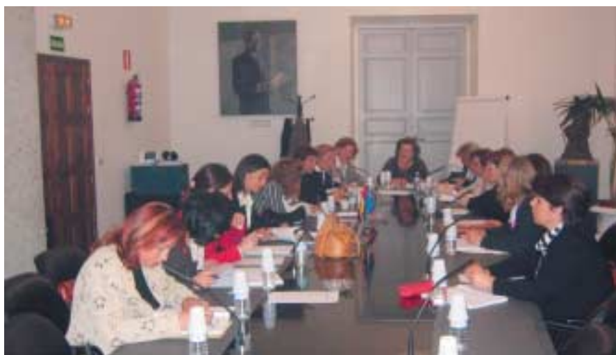
Constitución de la Comisión de Igualdad de la FEMP.

La Organización Mundial Ciudades y Gobiernos Locales Unidos (CGLU) pedirá a las Naciones Unidas un mayor reconocimiento de la experiencia de los Gobiernos Locales en lo relativo al desarrollo de iniciativas para favorecer la igualdad de género; y que este reconocimiento quede reflejado en textos internacionales tales como los Objetivos del Milenio. Dicha demanda forma parte de la Declaración de los Gobiernos Locales que será presentada en Nueva York, entre los días 28 de febrero y 11 de marzo, durante la 49 Sesión de la Comisión de Naciones Unidas sobre el Status de las Mujeres, Sesión en la que se revisará y evaluará el trabajo realizado por la Plataforma de Acción que se constituyó hace diez años, tras la celebración en Beijing de la IV Conferencia Mundial sobre la Mujer.