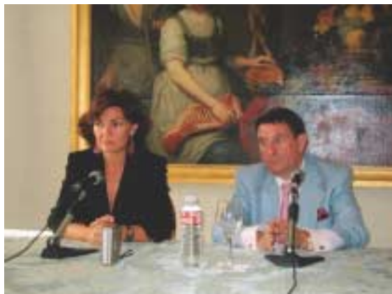
La Ministra de Cultura, Carmen Calvo, y el Presidente de la FEMP, Francisco Vázquez, al término de la entrevista que ambos mantuvieron el pasado verano.

Son miembros la Administración General del Estado, la Junta de Comunidades de Castilla-La Mancha y la FEMP. Los Ayuntamientos que lo deseen podrán incorporarse al Consorcio, al igual que otras entidades públicas o privadas, previa formalización de los correspondientes convenios.