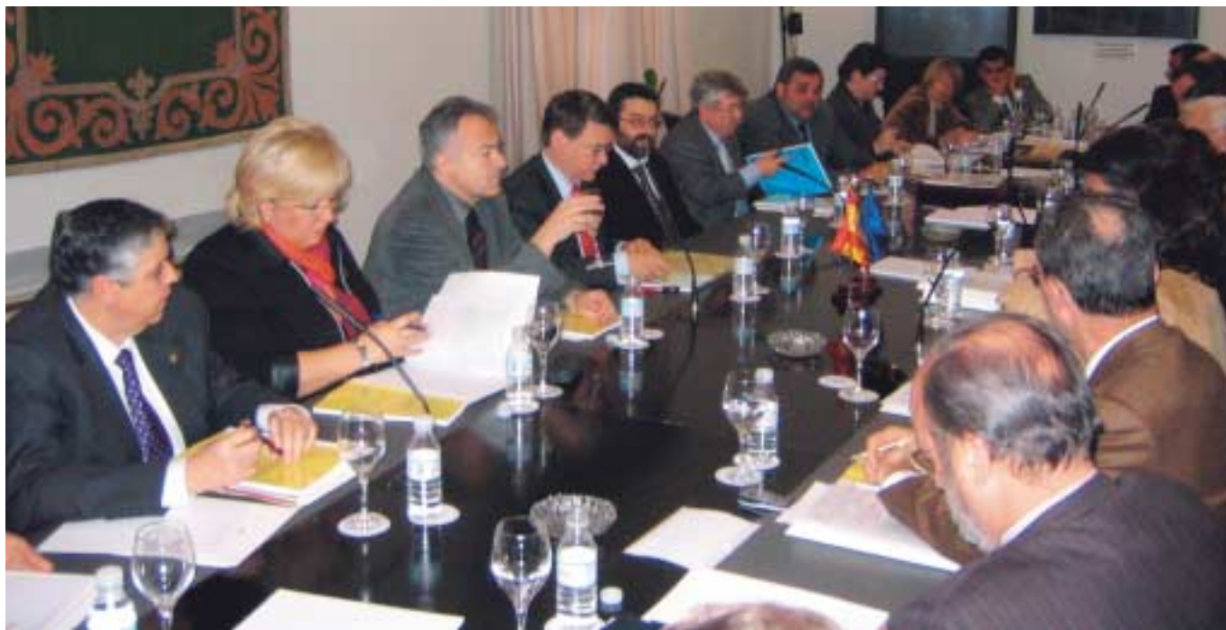
El Ministro Sevilla en un momento de la reunión con la Comisión Ejecutiva de la FEMP.

E l Gobierno presentó el Primer Borrador del Libro Blanco para la Reforma del Gobierno Local el pasado 17 de enero en la sesión constitutiva de la Comisión de Asuntos Locales, celebrada en la sede del Ministerio de Administraciones Públicas. Una semana después, el propio Ministro de Administraciones Públicas, Jordi Sevilla, explicó los contenidos del documento a los miembros de la Comisión Ejecutiva de la FEMP, con quienes debatió durante más de dos horas.