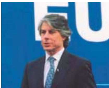
Los Europarlamentarios, Carlos Carnero (PSOE) e Iñigo Méndez de Vigo, (PP).

En relación con la falta de conocimiento de la población acerca de la Carta Magna, el Secretario de Estado recordó que en 1978, con la Constitución Española, también ocurrió algo parecido, ya que, “ es muy complicado pedirle a la ciudadanía que se lea todos los artículos de una Constitución ”, pero se mostró esperanzado en que el texto reciba el apoyo mayoritario de la ciudadanía española, porque, según afirmó “España no