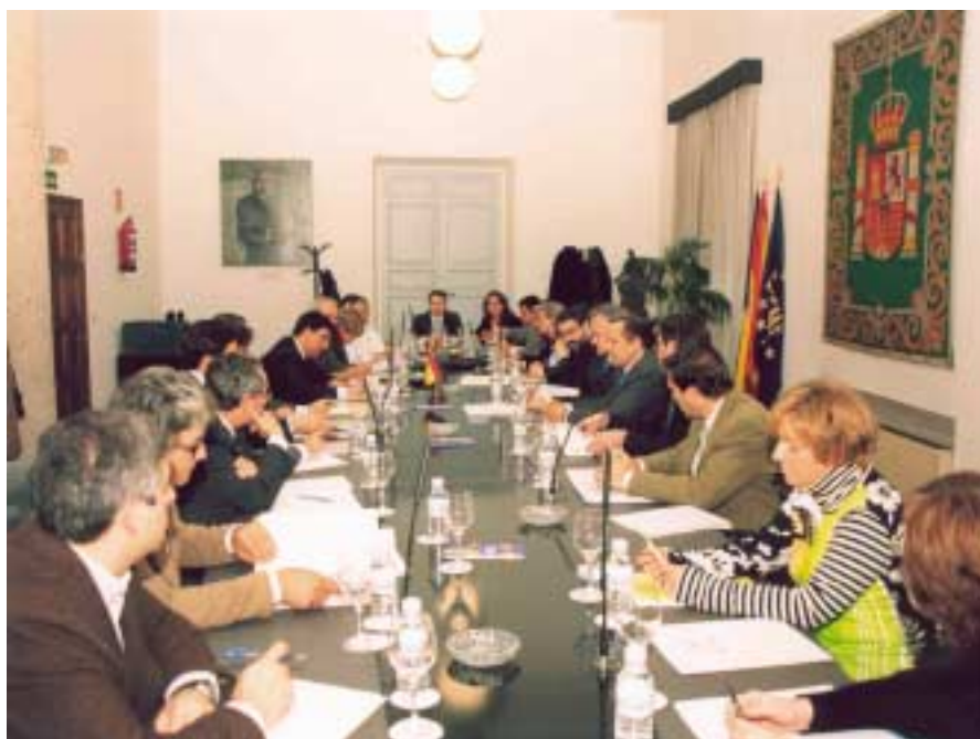
El Secretario de Estado de Cooperación Territorial, durante de la reunión con los Secretarios Generales de las Federaciones Territoriales de Municipios y Provincias, celebrada en la sede de la FEMP.

En concreto, se propone la posibilidad de introducir algunos elementos que incrementen las posibilidades de elección directa del Alcalde por los vecinos sin necesidad de elecciones separadas del Alcalde y los Concejales; así, en municipios con menos de 100 habitantes se seguiría usando el sistema actual de elección directa mediante sistema uninominal mayoritario; en los municipios de entre 100 y 1.000 habitantes, sería designado Alcalde el Concejil que más votos populares directos haya obtenido; en los municipios con más de 1.000 habitantes resultaría elegido Alcalde directamente el cabeza de la lista que haya obtenido la mayoría absoluta de los sufragios; podría estudiarse la posibilidad de que varias listas se vinculasen previamente a la elección y comunicasen a la administración electoral que apoyan como Alcalde al cabeza de la lista más votada entre las vinculadas. En todo caso, de introducirse un sistema de segundas vueltas para los supuestos de Ayuntamientos en los que no se alcancen mayorías absolutas en la primera, se considera que esta posibilidad debe ceñirse a las grandes ciudades manteniendo el número de Concejales resultado de la primera y exigiendo un alto porcentaje de votos para pasar a la segunda vuelta, que incluso podría reducirse a los dos candidatos más votados.