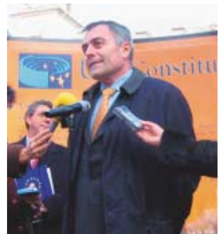
El Secretario de Estado para la Unión Europea, Alberto Navarro.

La campaña divulgativa sobre la Constitución Europea está organizada por la Fundación para la Investigación y el Desarrollo de América Latina y Europa “Juan de la Cosa”, en colaboración con el Ministerio de Asuntos Exteriores y de Cooperación, la FEMP, y las Oficinas en España del Parlamento Europeo y de la Comisión Europea.