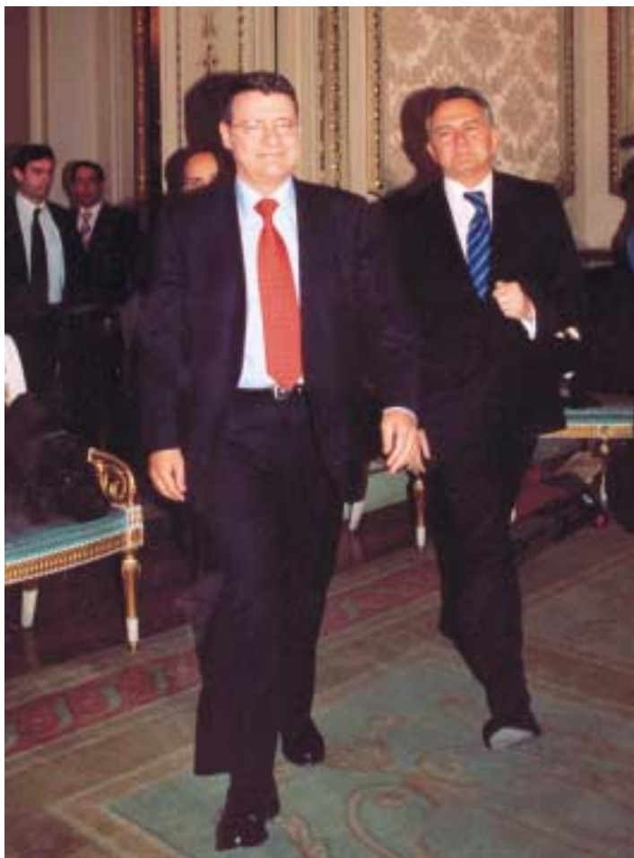
El Ministro de Administraciones Públicas, Jordi Sevilla, y el Secretario de Estado de Cooperación Territorial, José Luis Méndez.

propone una mejora en la formación y en la movilidad, así como el desarrollo y consolidación de la función pública directiva en el ámbito local. Y en cuanto a los bienes de las Entidades Locales defiende la necesidad de propiciar una optimización del patrimonio público local con el fin de racionalizar y renta-