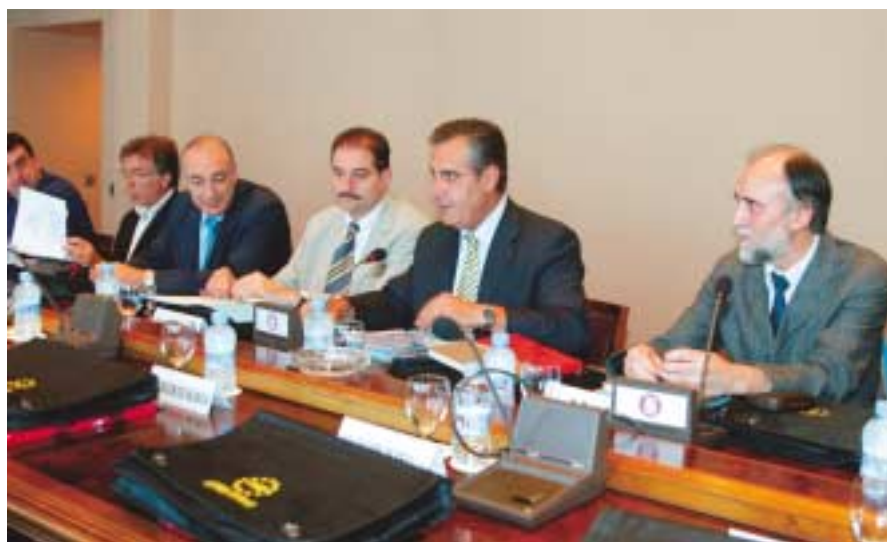
El Presidente de la Diputación de Barcelona, Celestino Corbacho, (segundo por la derecha), durante uno de los seminarios.

De los diferentes factores conjugados en la génesis de la situación actual, conviene resaltar el de la falta de planificación concertada de recursos entre los tres niveles de las instituciones del Estado en el proceso de descentralización llevado a cabo hasta ahora. Ha faltado fundamentalmente la participación de los representantes de los Gobiernos Locales en las instancias y niveles adecuados para desarrollar de manera equilibrada el Estado de las Autonomías. No se ha producido simultáneamente el segundo proceso de